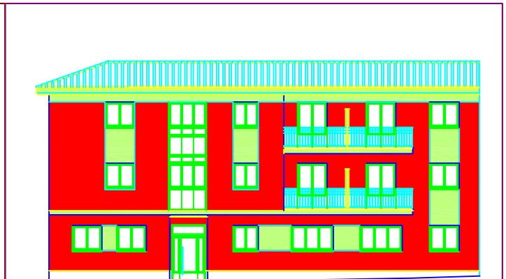
ALZADO CALLE DEL MOLINO